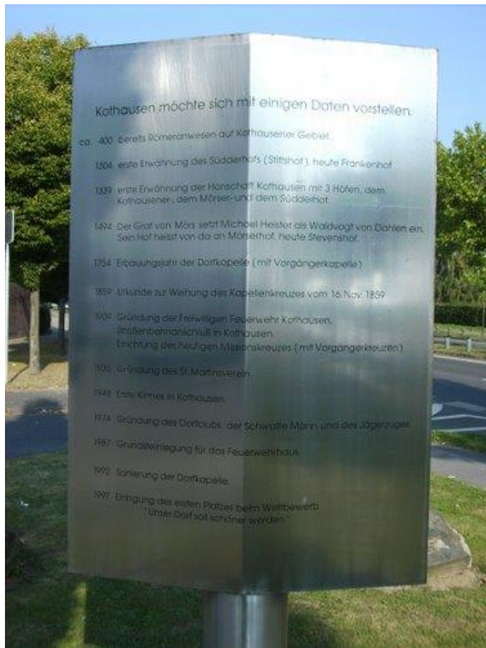
Kothausen stellt sich vor