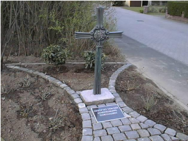
Wegekreuz an Christophorusstraße gest. Marinegruppe Dortheusen