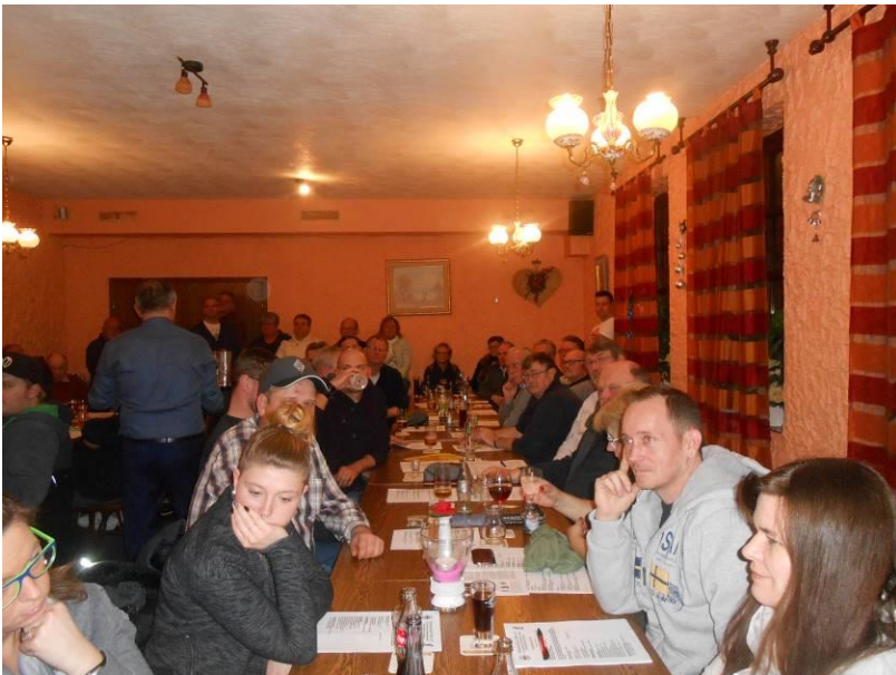
Full House im Hof

Von den Neuwahlen gibt es folgendes zu berichten: