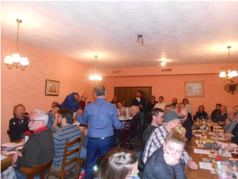
Interessierte Teilnehmer der Versammlung