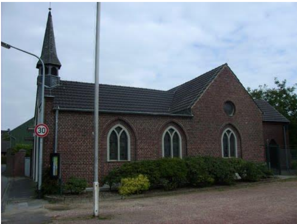
Johannes Kapelle in Gerkerath